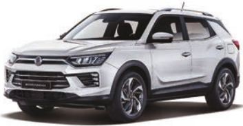
GRAND biela (WAA)