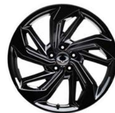
19" čierne ALU disky "Diamond Cutting", pneumatiky 235/50 R19