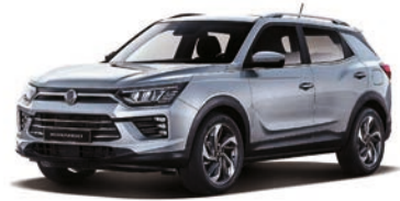
IRON kovová (ADE)