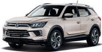
LATTE béžová (EBL)