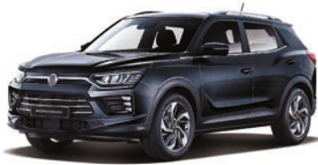
SPACE čierna (LAK)