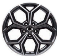
18" ALU disky "Diamond Cutting", pneumatiky 235/55 R18