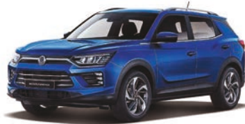
DANDY modrá (BAS)