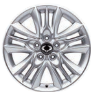
17" ALU disky, pneumatiky 225/60 R17