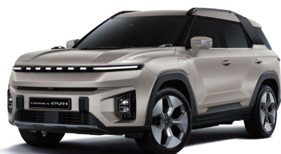
LATTE béžová (EBL)