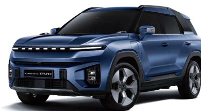
DANDY modrá (BAS)