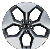
20" ALU disky "Diamond Cut"