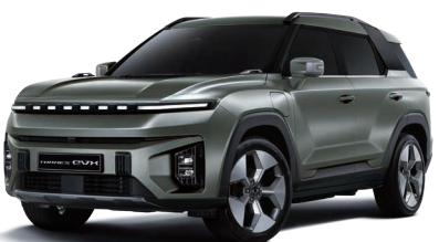
FOREST zelená (GAO)