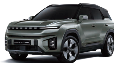
FOREST zelená s čiernou strechou (2GO)