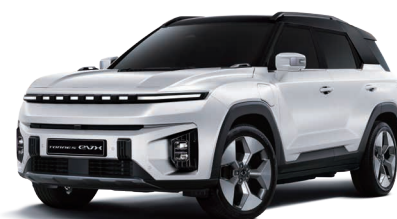
GRAND biela s čiernou strechou (2WA)