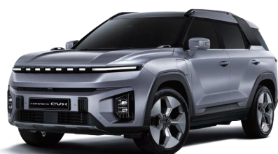
IRON kovová (ADE)