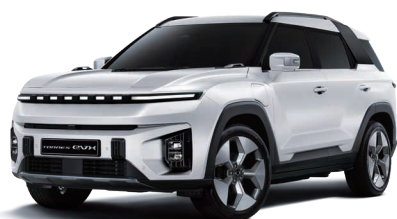
GRAND biela (WAA)