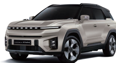
LATTE béžová s čiernou strechou (2BL)