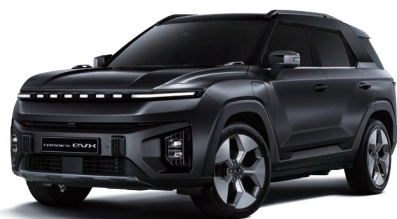
SPACE čierna (LAK)