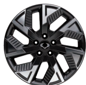
18" ALU disky "Diamond Cut"