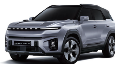
IRON kovová s čiernou strechou (2DE)