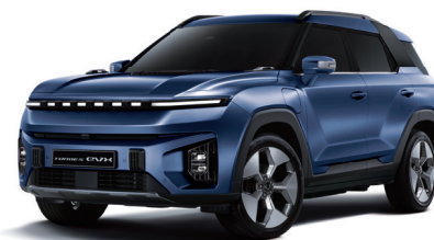
DANDY modrá (BAS)