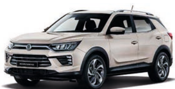
LATTE béžová (EBL)