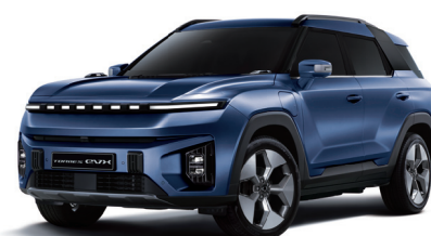
DANDY modrá (BAS)