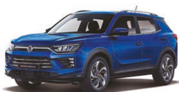
DANDY modrá (BAS)