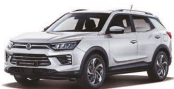
GRAND biela (WAA)