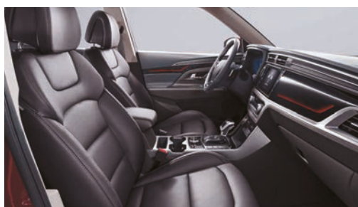
Čierna interiér (LBH)