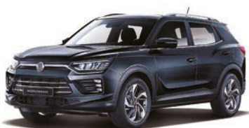
SPACE čierna (LAK)