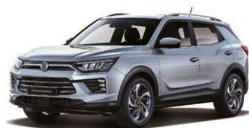
IRON kovová (ADE)