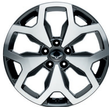
18" ALU disky "Diamond Cut", pneumatiky 235/55 R18