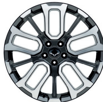
20" ALU disky "Diamond Cut", pneumatiky 245/45R R20