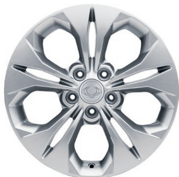
17" ALU disky, pneumatiky 225/60 R17